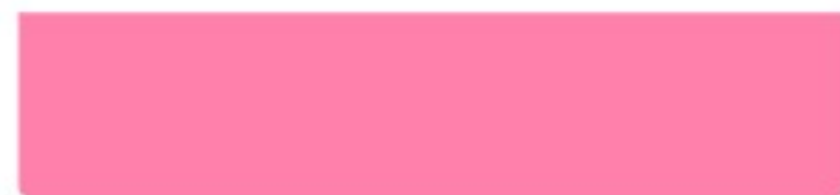
Niet-overheid, producent van biomassa