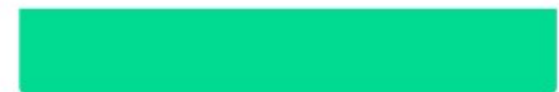
Niet-overheid, landschapsbouwer, eerder niet producent